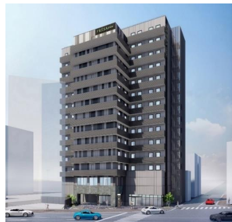
「相鉄フレッサイン 広島駅前」の外観（イメージ）