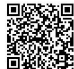
衛生管理の取り組みについて

詳細は相鉄ホテルズ公式ウェブサイト内「衛生管理の取り組みについて」にてご確認ください。 (URL https://sotetsu-hotels.com/covid_19 )