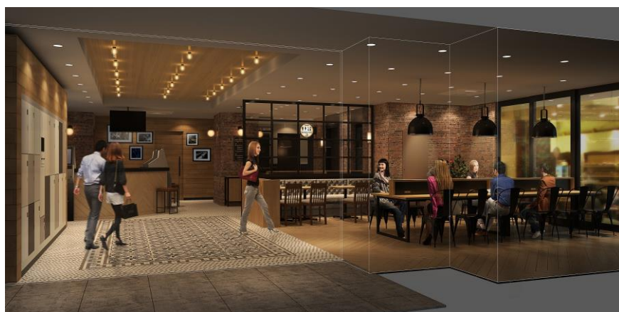
ホテルロビー（イメージ）