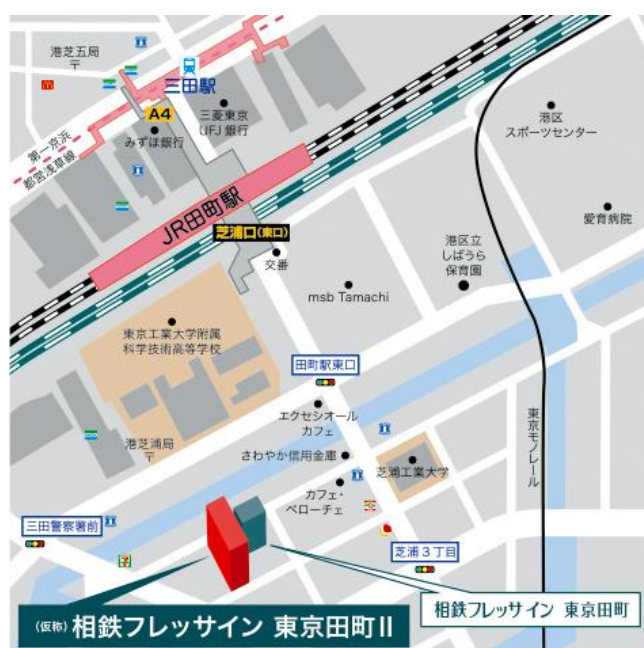
「(仮称)相鉄フレッサイン 東京田町Ⅱ」周辺地図