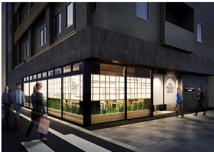
「(仮称) THE POCKET HOTEL 京都五条烏丸」 (イメージ)