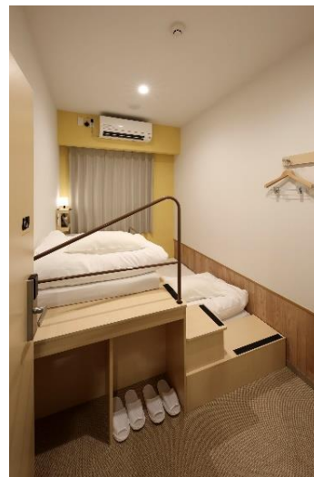
ステップツイン (イメージ)